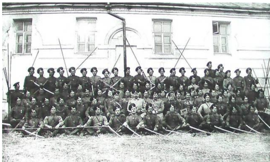
Черноярская сотня казаков, в центре командир полка полковник граф Артур Артурович Келлер, фото 1913 г., Саратов.*

*Фото из Астраханского государственного объединённого историко-архитектурного музея-заповедника.