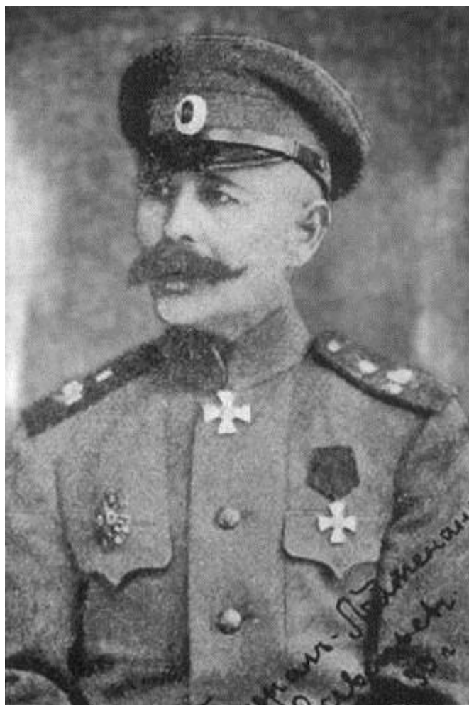
Начальник Астраханской казачьей дивизии, генерал-майор В.З. Савельев, 1919 г.