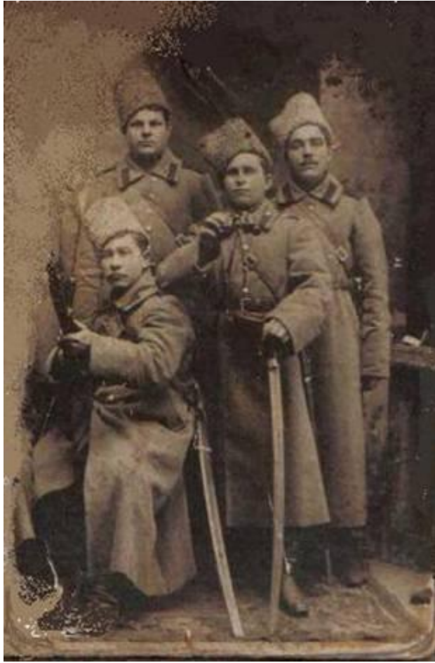
Фото начала XX века.