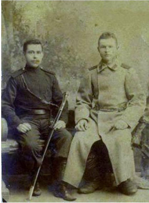
Фото начала XX века.