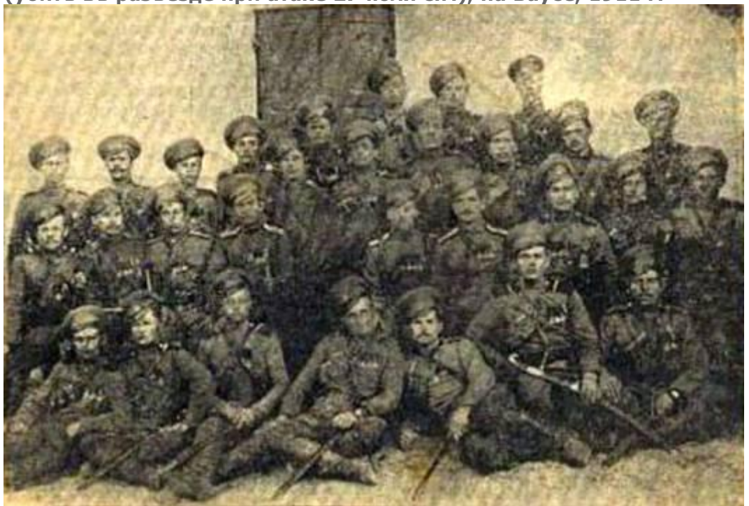
Группа Георгіевскихъ кавалеровъ 1-го Астраханскаго казачьего полка.