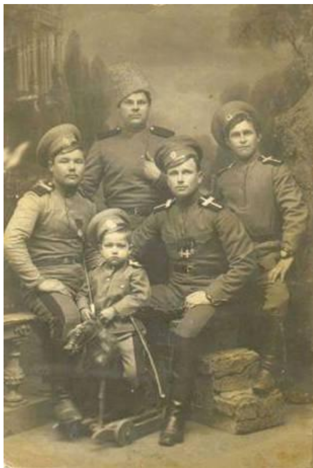
Фото начала XX века.