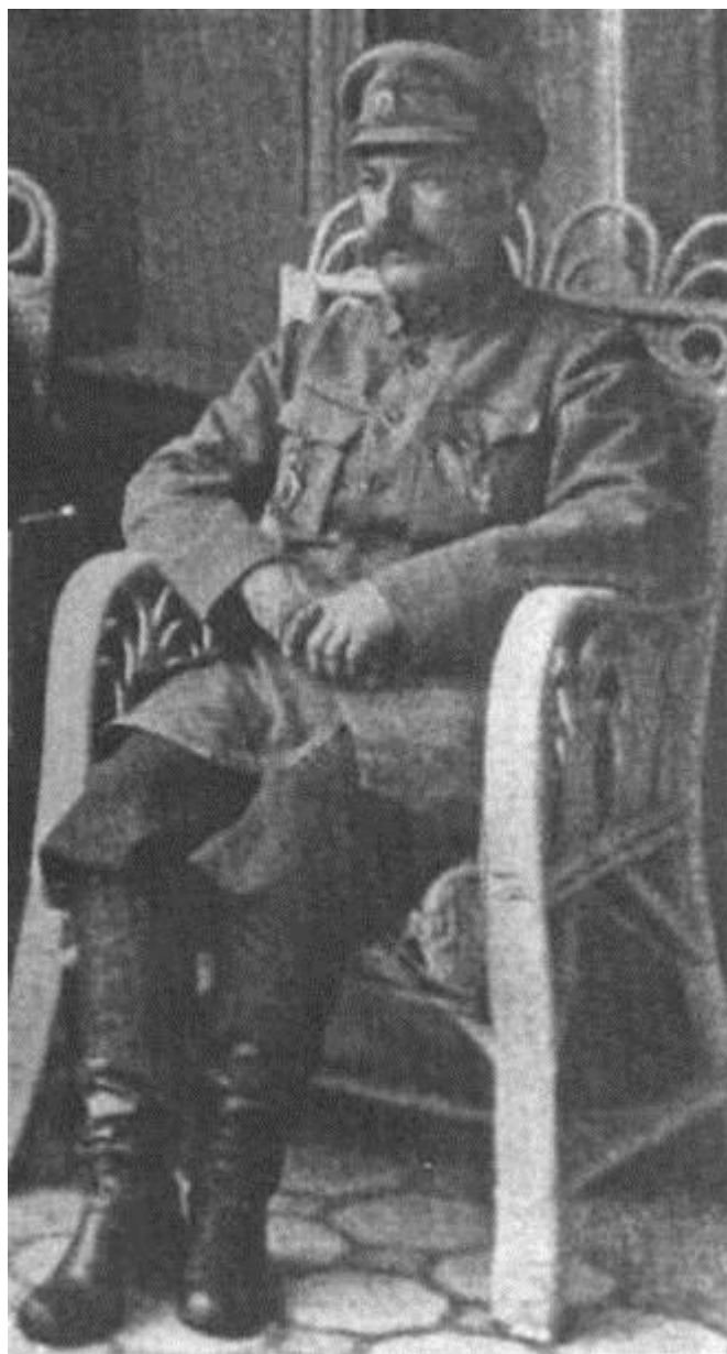
Начальник Астраханской казачьей дивизии, генерал-майор В.З. Савельев, 1919 г.