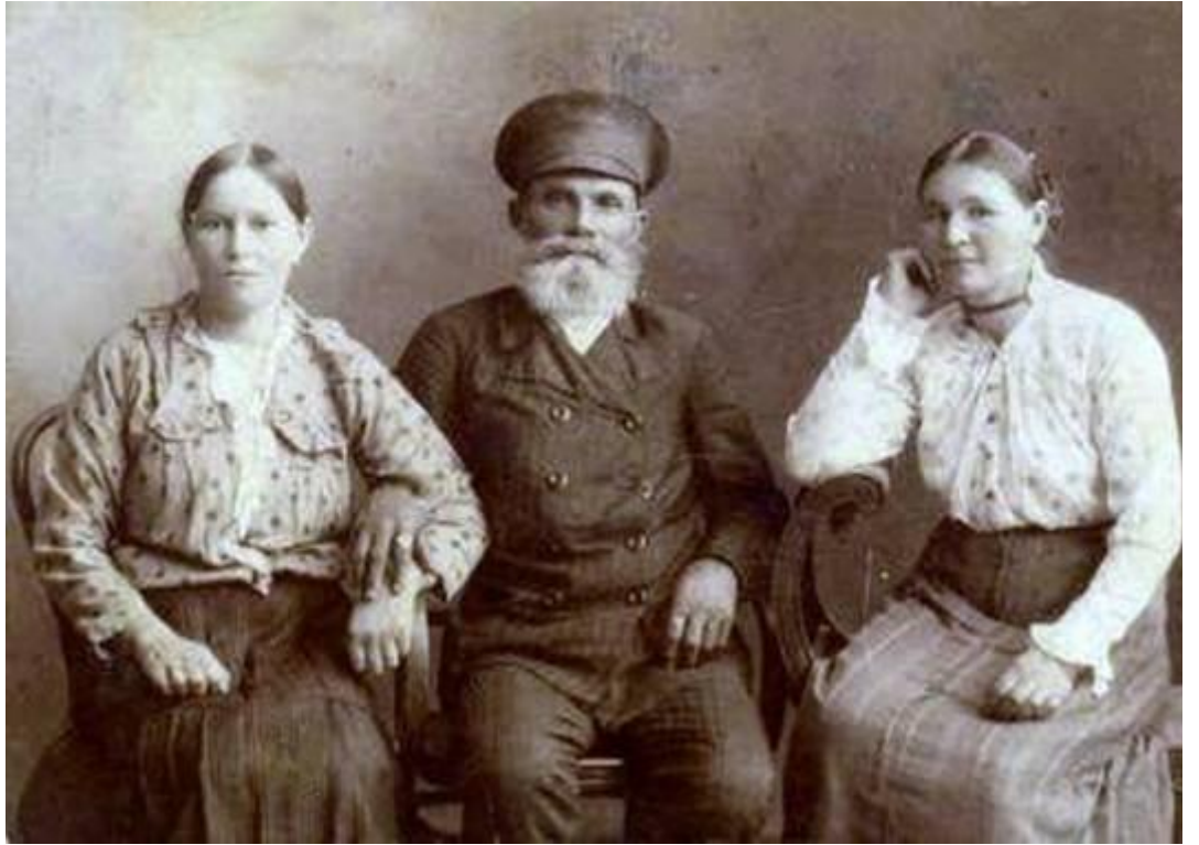
Семья астраханского казака. Фото начала XX века.