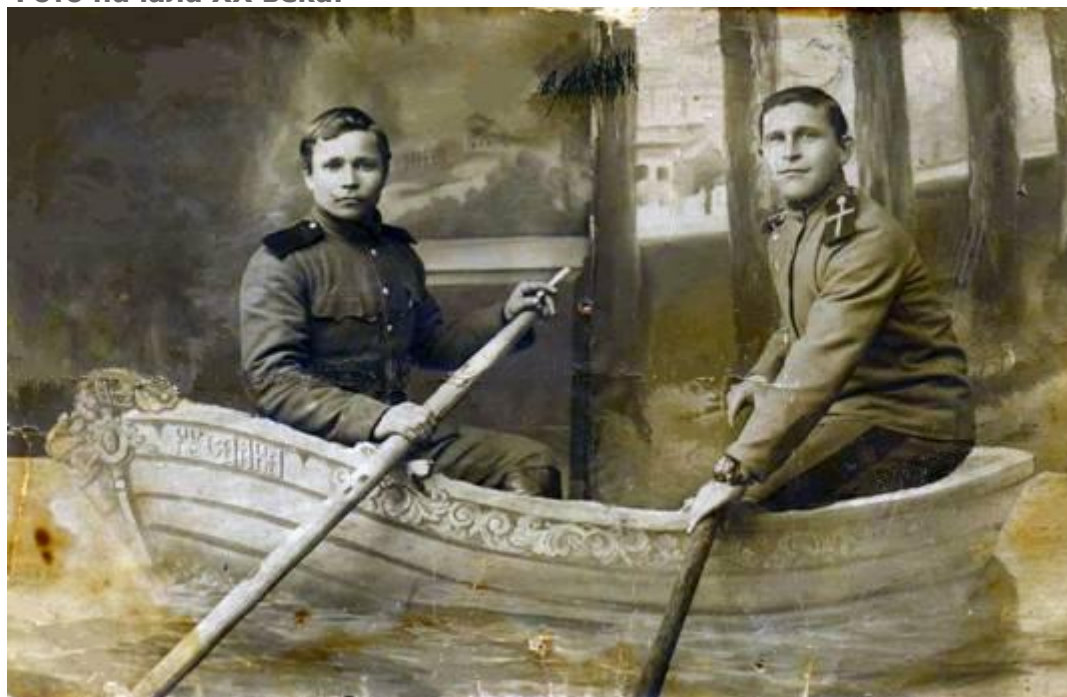
Фото начала XX века.