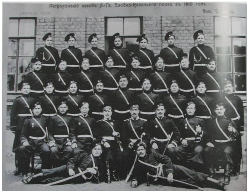
Астраханский взводъ Л.-Гв. Сводно-Казачьяго полка въ 1910 году.