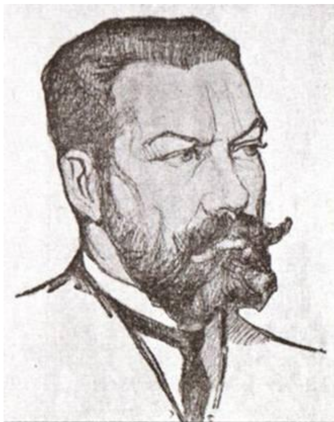
Председатель Астраханского войскового правительства Б.Э.Криштафович (август 1918 г.)*