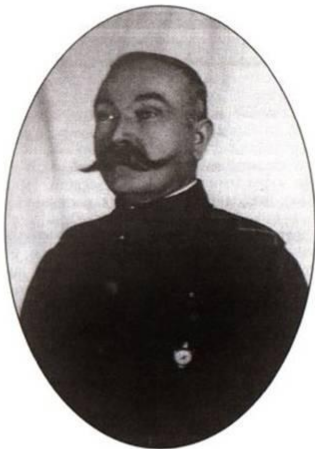
Нач. штаба АКВ генерал-майор А.Н.Донсков*