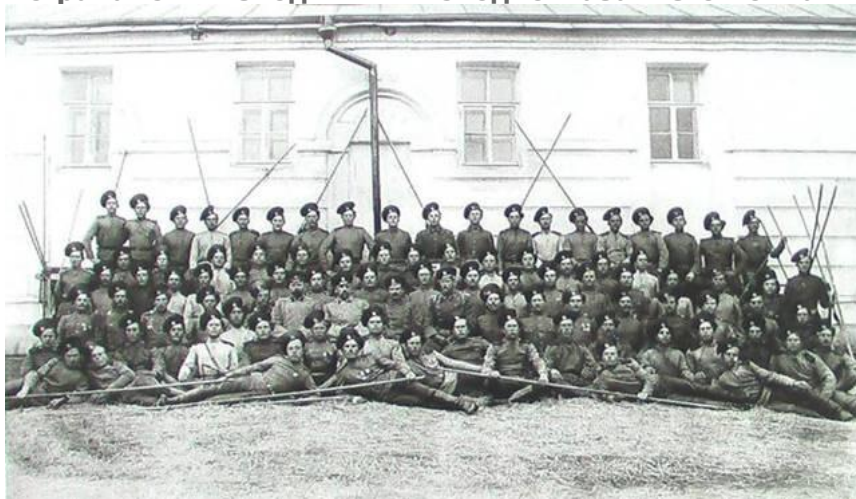
Красноярская сотня АКВ на праздновании 100-летия Отечественной войны 1812 года, фото 26 августа 1912 года.*