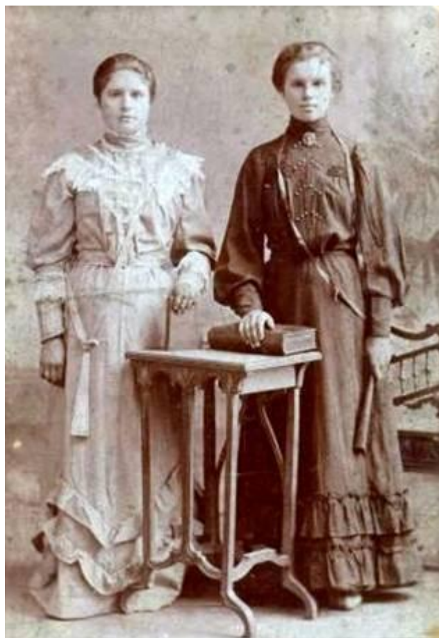
Фото начала XX века.