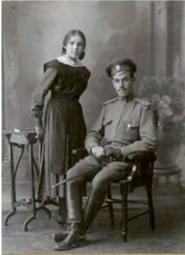
Фото начала XX века.